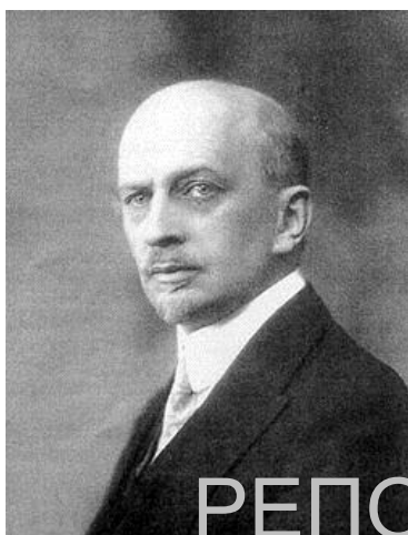
Иван Александрович Ильин (1883 – 1954)

При таком подходе создание той или иной философской системы в значительной степени будет определяться предметом философствования. Если предмет философа «в самом деле есть «система», то его философия верно передаст и изобразит ее; но если предмет есть бессвязная совокупность, то это обнаружится и в его предметной философии». Философ, который хочет успешно исследовать свой предмет, должен реально-опытно переживать его. Он должен превратить свою душу, сознание и мышление, свою жизнь в орган своего предметного опыта. Испытать и познать сущность