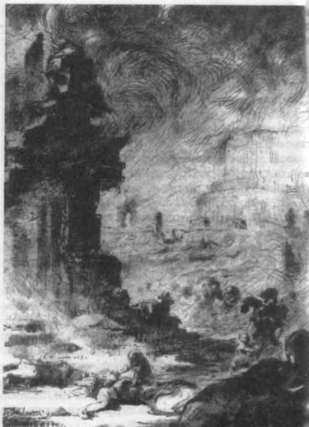
Малюнак Г.У.Заборскага "Горючий Минск. 24 июня 1941 г.". Беларускі дзяржаўны архіў навукова-тэхнічнай дакументацыі. НА РБ. Ф. 4п, воп. 3, спр. 1209, арк. 29—30.

25 июня. Продолжение бомбардировки. Самолётов немного, но методично, через 15—20 минут.