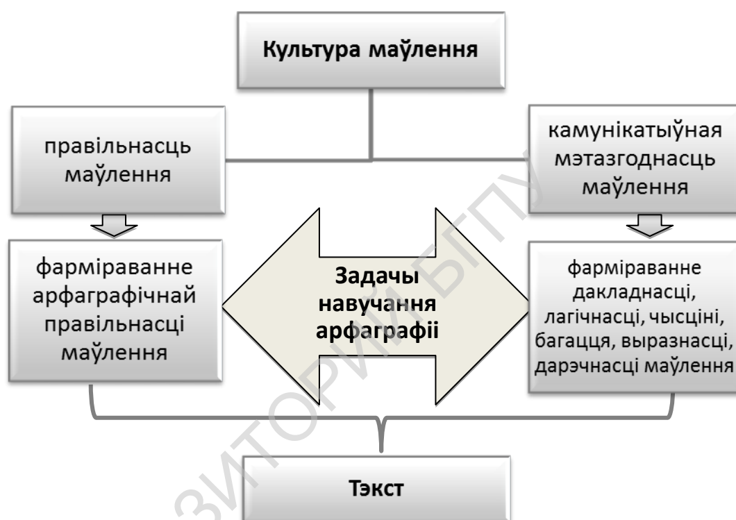
Малюнак 1. – Тэкст як асноўны сродак навучання арфаграфіі і культуры маўлення

ацэнцы зместу пераказаў, перакладаў, сачыненняў прымаецца пад увагу лагічнасць выкладу фактычнага матэрыялу; маўленчае афармленне творчых работ ацэньваецца па наступных крытэрыях: разнастайнасць слоўніка і граматычнага ладу маўлення вучняў (багацце маўлення) ; стылявое адзінства (дарэчнасць маўлення) ; выразнасць маўлення ; наяўнасць / адсутнасць маўленчых недахопаў (чысціня, дакладнасць маўлення) [11, с. 9].