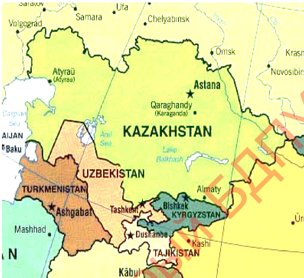
Рисунок 1 – Фізико-географічні умови Центральної Азії