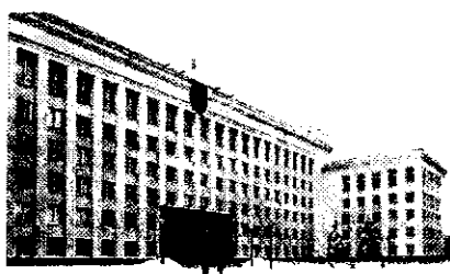
Беларускі дзяржаўны ўніверсітэт. Галоўны корпус.

У 1995/96 навуч. г. навуч. і навук. работу па 200 спецыяльнасцях праводзілі 39 дзярж. ВНУ (ун-таў, акадэміі, ін-таў, вышэйшых каледжаў), у якіх навучалася 174,2 тыс. студэнтаў, і 20 недзярж. ВНУ — 23,2 тыс. студэнтаў (гл. табл. 4). Вядзецца падрыхтоўка спецыялістаў па новых спецыяльнасцях: класічныя мовы і л-ра (лац., грэч.), японская і кітайская мовы, камерц. дзейнасць на рынку тавараў і паслуг, метралогія, перспектывыя кірункі псіхалогіі (паліт. псіхалогія, этнапсіхалогія і інш.), стандартызаваныя і сертыфікацыя, тэхналогія і паліграф. вытв-сць і інш. Рэфармаванне вышэйшай школы ідзе ў кірунку паступовага пераходу да шматузроўневай сістэмы вышэйшай адукацыі: 1-ы ўзровень — падрыхтоўка спецыялістаў з вышэйшай адукацыяй (4—5 гадоў), 2-і — паглыбленая падрыхтоўка (1—2 гады). Першы ўзровень прадугледжвае магчымасць атрымання адначасова з вышэйшай адукацыяй акад. ступені бакалаўра; другі — паглыбленую падрыхтоўку спецыялістаў у канкрэтным кірунку прафес. дзейнасці і атрымання пры дадатковым навучанні акад. ступені магістра. Вядзецца распрацоўка стандартаў адукацыі, якія з'яўляюцца базай для атэстацыі і акрэдытацыі навуч. устаноў, статуса дыплама аб адукацыі, яго эквівалентнасці за межамі