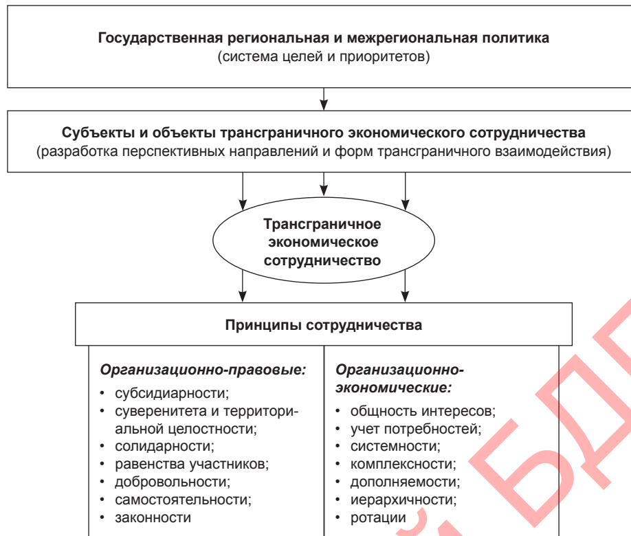
Рисунок 2 – Модель трансграничного экономического сотрудничества