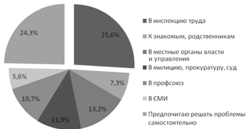
Рисунок 3 – Распределение ответов респондентов на вопрос об инстанции, в которую бы респондент обратился при нарушении его трудовых прав, условий труда, %

В ходе анализа были скоррелированы два вопроса – «Как Вы оцениваете материальное положение Вашей семьи?» и «Что лично Вы бы предприняли, если бы нарушались Ваши трудовые права?». При этом во втором вопросе акцентуация была сделана на альтернативе «ничего бы не предпринимал». Интерес к данной альтернативе обусловлен необходимостью выявления влияния экономического фактора на активность респондента при нарушении его трудовых прав на предприятии. Результаты корреляционного анализа показали, что почти треть (29,1 %) опрошенных респондентов, которые идентифицируют материальное положение своей семьи как плохое и большинство (52,7 %) опрошенных респондентов, которые идентифицируют материальное положение своей семьи как среднее, выбрали бы пассивность в случае нарушения их трудовых прав.