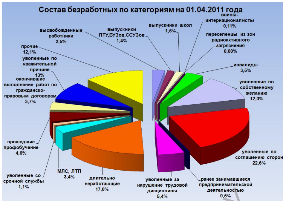
Рисунок 1 – Состав безработных по категориям на 01 апреля 2011г.

* Сайт Министерства труда и социальной защиты Республики Беларусь