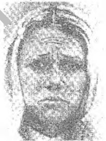
Рис. Стимульный материал к методике FMST