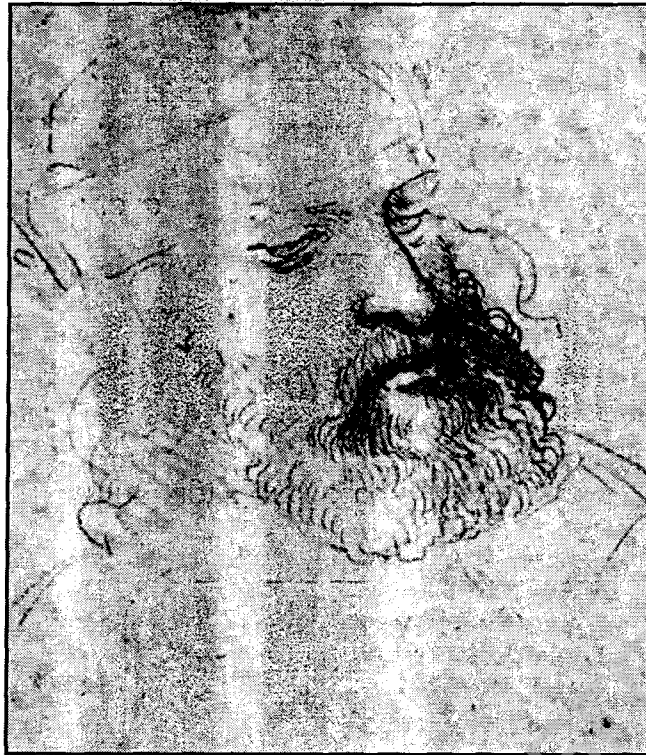
Рис. 2. Портрет мужчины с бородой (Цезаре Борджиа) Ок. 1502-1503 гг. Санцига

Эпизод службы Леонардо и Макиавелли, двух великих гуманистов эпохи Кватроченто, у такого «морального уродца», как Цезаре Борджиа (Рис. 2) является очень примечательным. С Макиавелли все ясно, он наблюдал и писал свою книгу «Государь», а Леонардо, он тоже наблюдал, ему, как мне кажется, одинаково интересно было наблюдать и красоту и уродство, как внешнее, так и внутреннее, в этом и состоит суть работы психолога. Именно в этот период (1495-1502) у него появляется серия рисунков изображающих гротескные лица, различных уродов и, вместе с тем рисунки прекрасных, красивых людей. Он как бы оставался при этом бесстрастным наблюдателем, одновременно анализируя разницу.