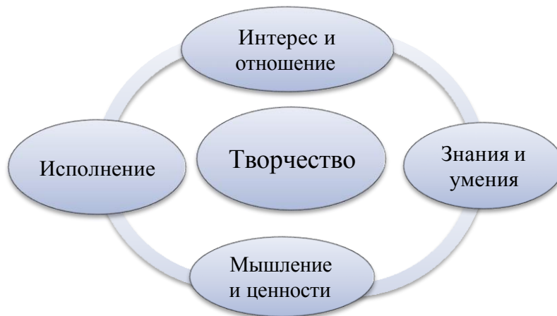
Рисунок 1. – Схема компонентов художественной грамотности