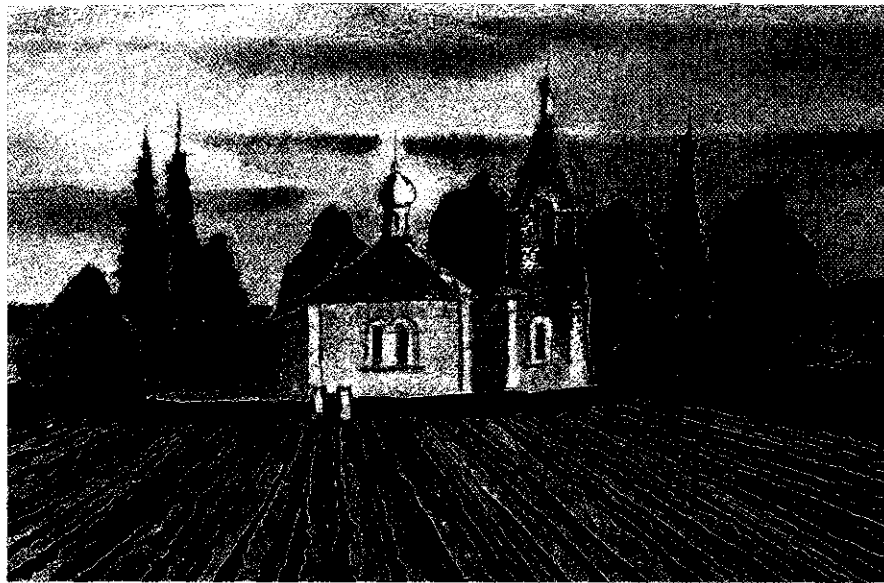
Аляксандр Лакотка. Бласлаўлёная праца хлебадара , 2018 г.

Сярод аптычных прыёмаў, што скажаюць уяўленне аб існым, мастак выкарыстоўвае т. зв. падманкі. Неадпаведнасці выяўленага і рэальнага надаюць акварэлям А.Лакоткі чарадзейную сілу, што вабіць акунца ў казачна-фантастычны свет, поўны невытлумачальных з'яў. То промні святла бесперашкодна пранікаюць скрозь важкі аб'ект, ламаючы ўяўленне аб матэрыяльнасці прадметаў і рэчаў. То светлавяя патокі, быццам бы праходзячы праз сістэму лінз, шматразова праламляюцца і факуюцца на аб'ектах такім чынам, што змяняюць характарыстыкі фізічных цел. Часам формы становяцца пластычнымі, цякучымі, падобнымі да сюррэалістычных выяў.