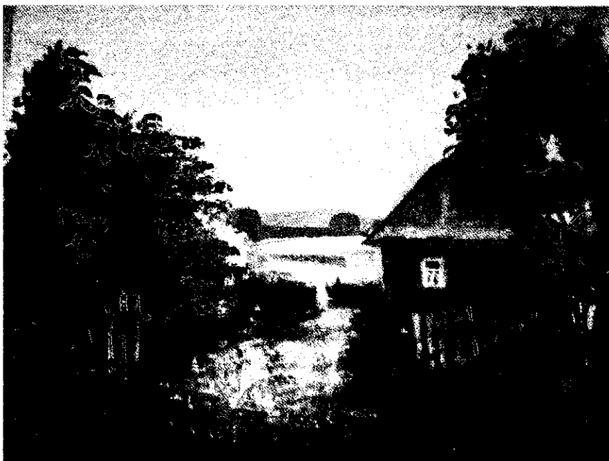
Аляксандр Лакотка. Раніца туманная , 2019 г.

Светлаколеравая дынаміка выступае галоўным сродкам мадэлявання вобразаў роднага краю ў акварэлях А.Лакоткі. Святлом ахопліваюцца асобныя планы, часткі кампазіцыі, тым самым акцэнтуючы адвечныя каштоўнасці быцця. З імманентнай імпрэсіяй мастак будзе фармальныя і сюжэтныя кампазіцыі, у якіх узаемадзеянне светлавых патокаў і колеравых плям аніміруе прастору, насычае яе тымі характарыстыкамі, з якіх фарміруецца светаадчуванне.