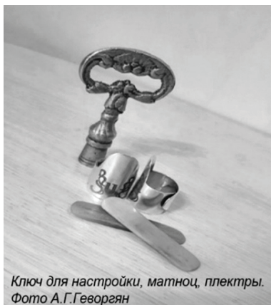
Ключ для настройки, матноц, плектры.

инструмента используют дуб, ель, ореховое дерево. Боковые стороны корпуса и нижнюю деку изготавливают из берёзы, ореха, абрикоса и других твёрдых пород. Верхняя дека инструмента частично обтянута кожей. На кожаной части, разделённой на 4 равных отрезка, располагается деревянная подставка во всю ширину инструмента. Над ней проходят нейлоновые струны, прикрепляясь в левой части инструмента к колкам, а в правой части — к специальным отверстиям в корпусе. Деревянные колки (армяне называют их «уши») регулируют натяжение 78 струн, расположенных в 26 рядов. Настраивается канон металлическим ключом, внутреннее отверстие которого имеет форму четырёхгранника. Рядом с колками под струнами располагаются «линги» (металлические рычаги), с их помощью исполнитель может быстро менять натяжение струн и, соответственно, высоту звуков на тон и полутон.