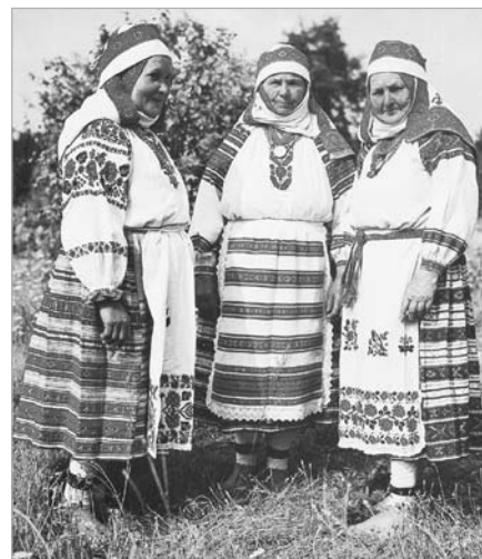
Жаночыя строі сяла Маларыта. Заходняе Палессе.

Сімвалам ↓ пазначаны матэрыялы, даступныя для спампоўвання і азнамлення, спасылкі па qr-кодзе.