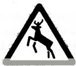
Рыс. 4. Дзікія жывёлы

— Ці ведаеце вы дарожныя знакі, якія папярэджваюць вадзіцеляў, што на дарогу могуць выбягаць жывёлы? Апішыце, як выглядаюць гэтыя знакі (рыс. 4, 5). (Настаўнік выслухоўвае адказы вучняў, вывешвае на дошку знакі, паведамляе дзецям іх назвы і гаворыць пра тое, што першы знак папярэджвае вадзіцеляў аб магчымасці выхаду на дарогу кабана, лася, аленя, паколькі гэты ўчастак дарогі можа ўваходзіць у маршрут руху жывёл, а другі — што на ўчастку дарогі магчыма масавае з'яўленне земнаводных, у прыватнасці жаб.)