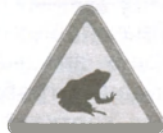
Рыс. 5. Сезонныя міграцыі земнаводных