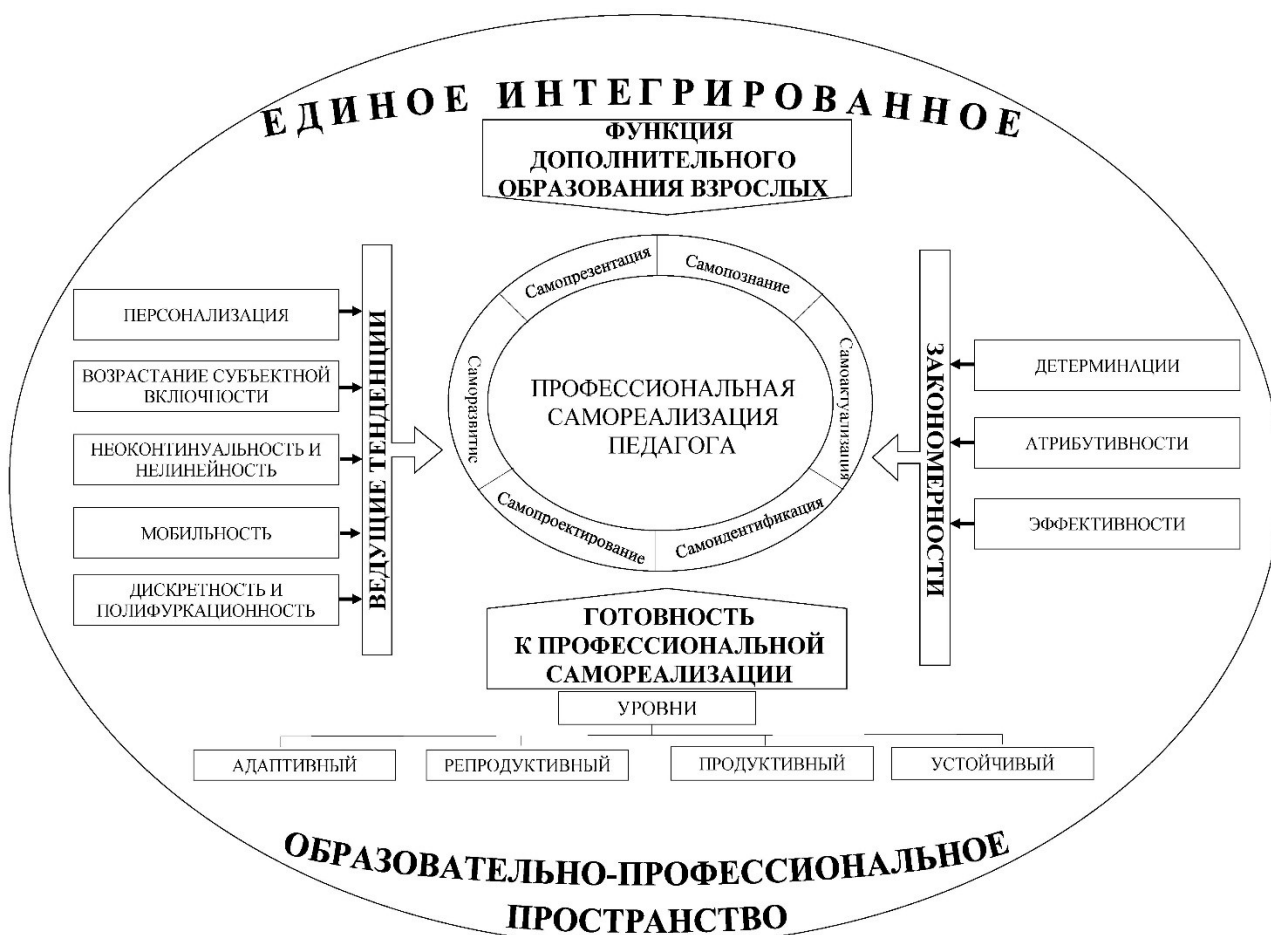
Рисунок 2. – Профессиональная самореализация

Полипарадигмальный подход, систематизируя знания о стратегиях ДОП, создавая теоретико-методологическую базу для их анализа и оценки, обобщая потенциал ведущих парадигм и выявляя их приоритетные связи в концептуальном множестве, вырабатывает направления, продуцирует новые стратегии и обеспечивает интегративные процессы в стратегическом проектировании развития и совершенствования дополнительного образования с целью непрерывного и системного развития готовности к педагога профессиональной самореализации как основного предиктора его самореализации в профессии.