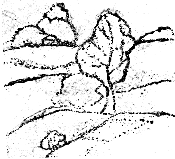
Работа на фотобумаге «Дерево»