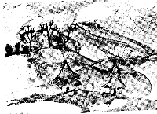
Работа с нитками «Холмы и леса»

Художественные техники и техники неразрывно связаны с познавательной деятельностью, они активизируют восприятие и развивают творческое воображение, настраивают на продуктивное творчество и экспериментирование, поддерживают интерес к художественной творческой деятельности. Укрепление развития эстетического интереса способствует яркому проявлению и осознанию учащимися своих внутренних сил, создает благоприятные условия для осуществления верной методической направленности учебного процесса, когда педагог не подавляет инициативность самостоятельности учащихся, но стремится создать наилучшую обстановку проявления их творческой активности.