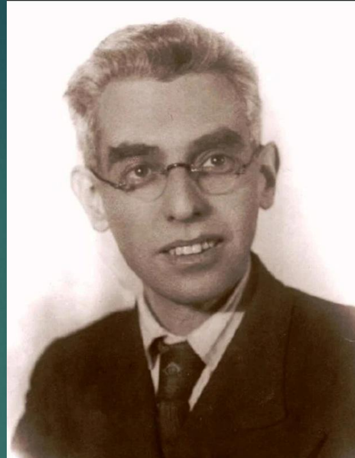
А.Р.Лурья - малады вучоны