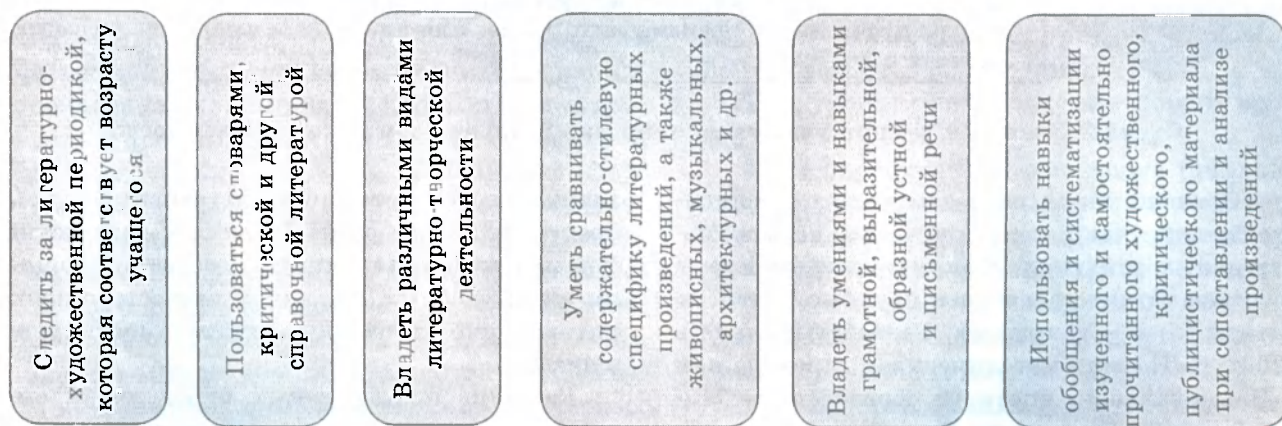
Схема 1. Практическое применение знаний и умений учащихся

Основные цели литературного творчества учащихся: развитие связной устной и письменной речи, индивидуального языкового стиля учащегося, литературно-творческих и читательских способностей (творческого воображения, словесно-образного мышления, художественной наблюдательности и интуиции, способности к сопереживанию и постижению психологии человека, остроты восприятия человека и природы); практическое овладение основными жанрами художественной литера-