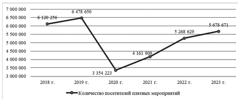
Рисунок 2 – Количество посетителей платных мероприятий, организованных клубными учреждениями