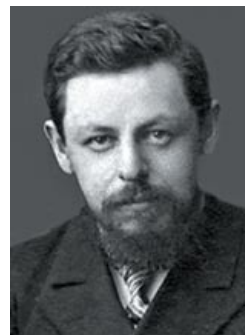
Евгений Викторович Тарле