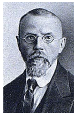
Михаил Николаевич Покровский

То, что убийство Франца Фердинанда в Сараево стало поводом к войне, у исследователей сомнения никогда не вызывало. Вопрос в другом: было ли покушение единственным актом мести националистов или его инспирировали внешние силы, другими словами, причастны ли к нему правительственные организации Сербии и России, да и других держав Антанты. В первые годы советской власти историки склонны были обвинять царское правительство в прямом участии в организации покушения. В научный оборот этот взгляд ввел М.Н. Покровский в ряде статей, в т. ч. «Как готовилась война», «Как возникла мировая война», «Антанта», «Происхождение и характер войны», объединенных им под обложкой неоднократно переиздававшегося сборника «Империалистская война». Покровский утверждал, что «вспыхнула война по инициативе, несомненно, Антанты», война была «нападательной» с ее стороны вообще и России в частности. В докладе, сделанном на собрании московской интеллигенции 4 августа 1924 года по поводу 10-летнего юбилея начала войны, он говорил, что убийство австро-венгерского эрцгерцога спровоцировала телеграмма русского главного штаба, извещавшая сербскую разведку, что Франц Фердинанд готовится совершить нападение на Сербию и что маневры в Боснии, на которые он должен приехать, есть лишь предлог для сосредоточения австрийской армии, которая должна осуществить это нападение.