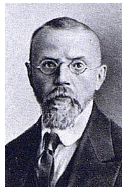
Михаил Николаевич Покровский

Проблема международных отношений и внешней политики России привлекла Покровского еще до Октябрьской революции. Первая статья по этой теме («Русский империализм в прошлом и настоящем») опубликована в 1914 году. Затем последовали другие, они были многочисленны и разнообразны по жанрам.