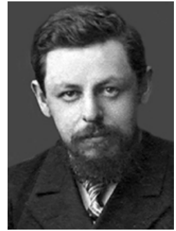
Евгений Викторович Тарле