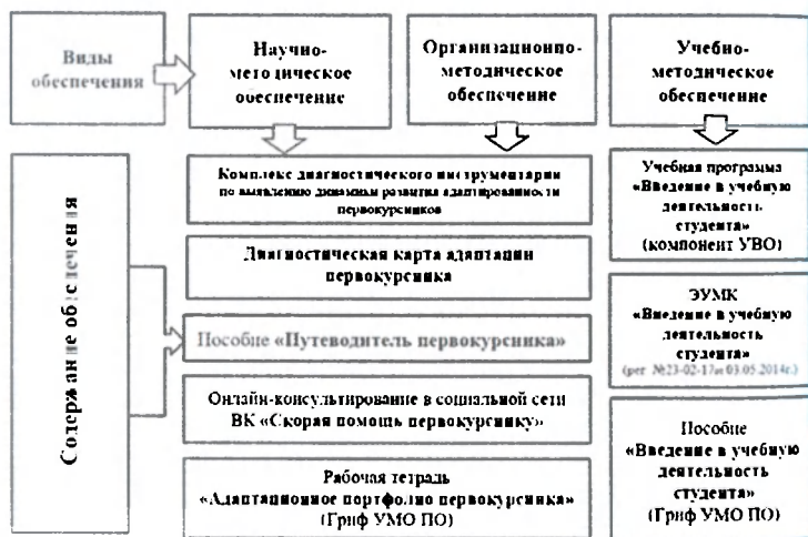
Рисунок 2 – Комплекс методического обеспечения социально-педагогической поддержки первокурсников в процессе адаптации в учреждениях высшего образования

На основе полученных данных нами был разработан комплекс педагогических средств социально-педагогической поддержки адаптации первокурсников к образовательной среде университета, который представляет собой целостную систему, включающую образовательные ресурсы для развития учебного труда студента с учетом компетентностного подхода (рисунок 2).