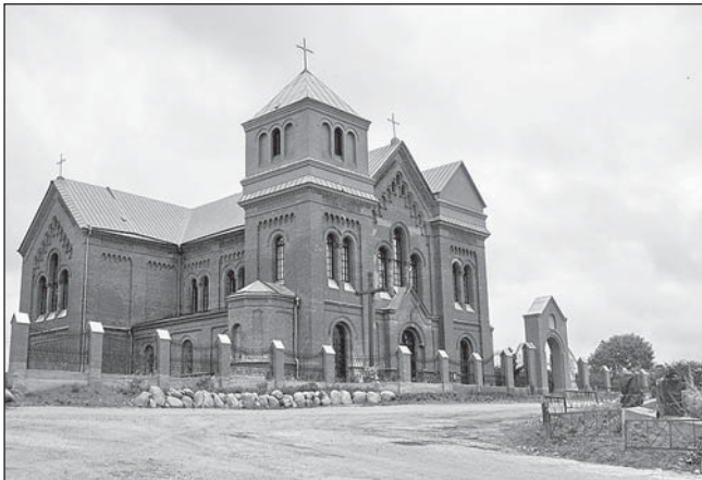
Росіцкі Свята-Траецкі касцёл.