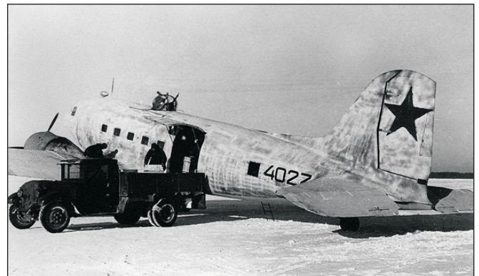
Ваенна-транспартны самалёт ЛІ-2, створаны на базе амерыканскага самалёта Дуглас DC-3.

З часці, дзе служыў Эдуард, прыйшла пасылка, у якую баявыя таварышы беражліва ўклалі гвардзейскі