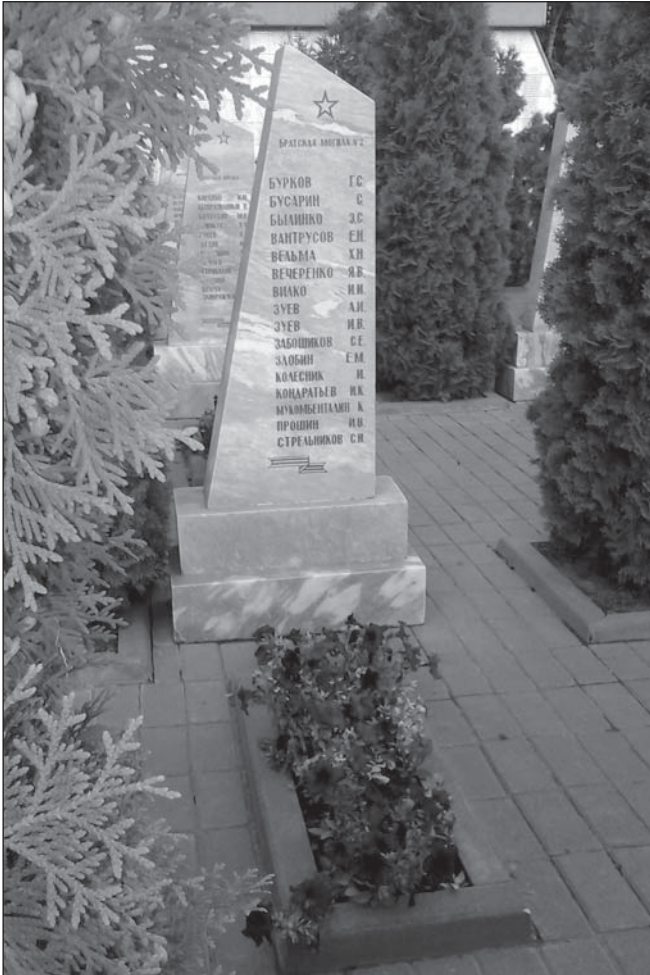
Брацкая магіла на плошчы Герояў г. Ліпецк, у якой пахаваны Э.Былінка.