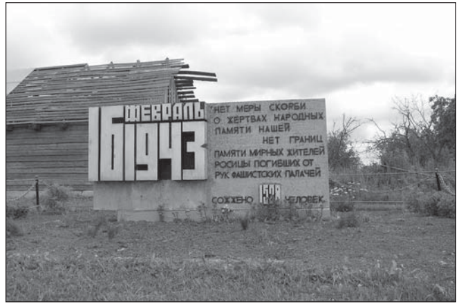
Мемарыяльны знак у памяць аб ахвярах мірнага насельніцтва ў вёсцы Росіца.

Росіца — адно з раннях паселішчаў Паўночна-Заходняга Падзвіння. Першыя пісьмовыя згадкі пра яго датуюцца 1599 г., калі паселішча было выкуплена Львом Сапегам у Давыда Росіцкага. У 1772 г. Росіца ўвайшла ў склад Расійскай Імперыі і знаходзілася ў Дрысенскім павеце Віцебскай губерні. Тут былі царква, касцёл, сінагога, а росіцкія кірмашы збіралі шмат навакольнага насельніцтва. Згадвае Росіцу і Энцыклапедычны слоўнік Бракаўгаўза і Ефрона: " мястэчка Віцебскай губерні, Дрысенскага павета, пры рацэ і возеры той жа назвы, у 19 вёрстах ад павятовага горада. Жыхароў 300 " 1 .