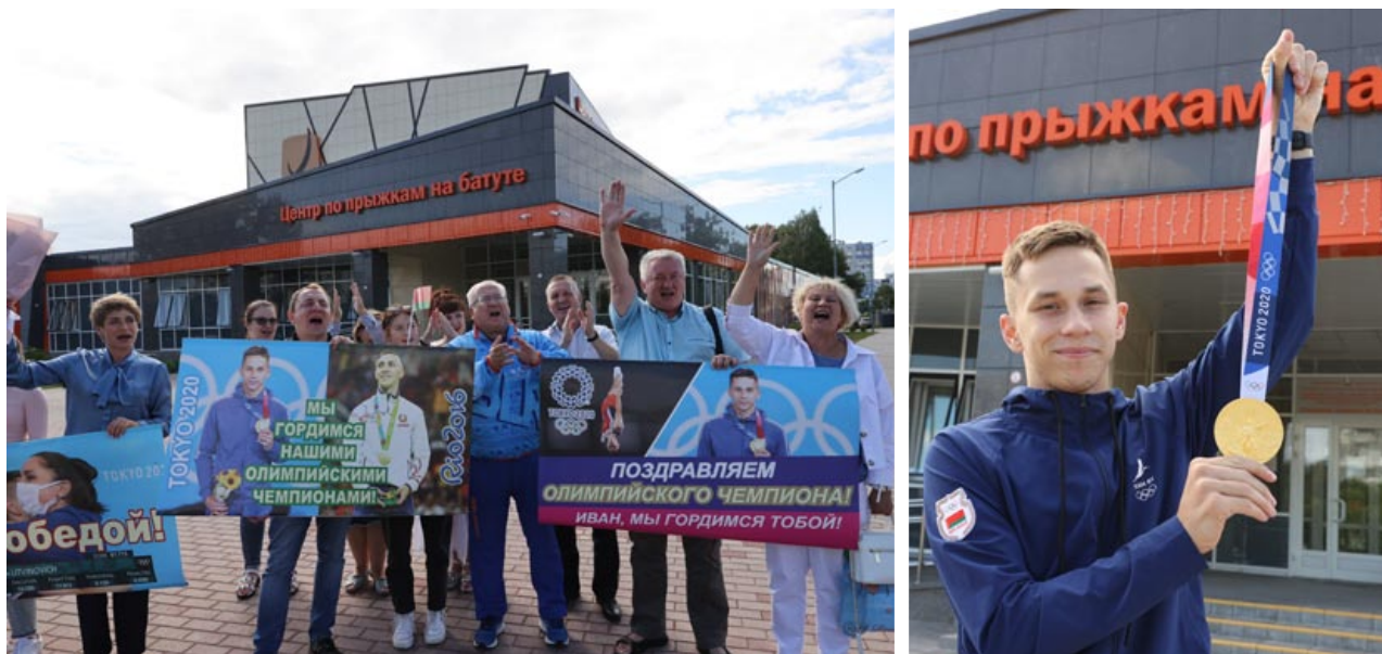
Олимпийского чемпиона – 2020 по прыжкам на батуте Ивана Литвиновича радостно встречали в родном Витебске. Август 2021 года

Так, польское издание WP.pl не менее одного раза в неделю освещает белорусский спорт в контексте происходящих общественно-политических событий. Такой вывод можно сделать на основании ввода в поисковой строке сайта запроса «białoruski sportowiec» (белорусский спорт). Новостной ресурс GAZETA.pl по аналогичному запросу предоставляет статьи на тему репрессий в отношении белорусских атлетов. Большинство комментариев к данным материалам носят явно негативный характер. «Koniec białoruskiego sportu» («конец белорусскому спорту») – один из самых популярных комментариев под материалом с названием «Białoruski sport pod presją polityki. Świat powinien zareagować» [9]. И это высказывание имеет более 200 отметок «нравится».