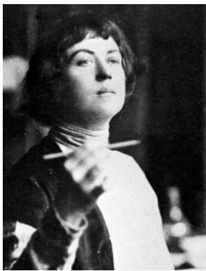
Александра Михайловна Коллонтай