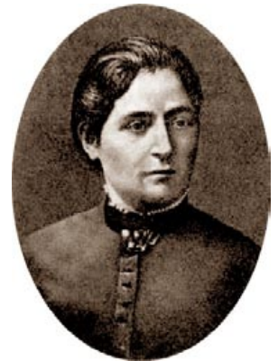
Любовь Исааковна Аксельрод

В условиях революции российские партии, заинтересованные в поддержке со стороны женских масс, усилили работу среди них и провели съезды женщин. Социалистические и демократические партии усилили работу в профсоюзах, союзах солдаток, среди крестьянок. На волне революции возникли и активно выступали «Женская прогрессивная партия», «Всероссийский союз равноправия женщин» и другие политические организации. Только в Москве и Петрограде действовали 33 женские организации и общества взаимопомощи. Брошюры, посвященные правам человека и женскому вопросу, наводнили страну, как это уже было в 1905 году [20–23]. Отдельной брошюрой были изданы фрагменты из стенографических отчетов, отразившие полемику по вопросу о равноправии женщин в I Государственной Думе, где дебаты по данному вопросу