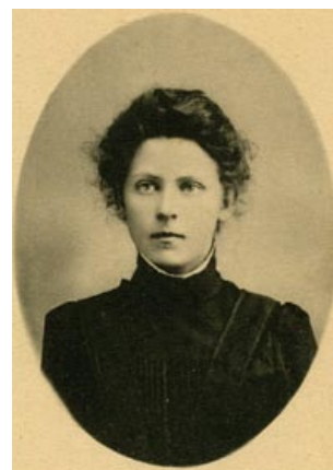
Мария Александровна Спиридонова