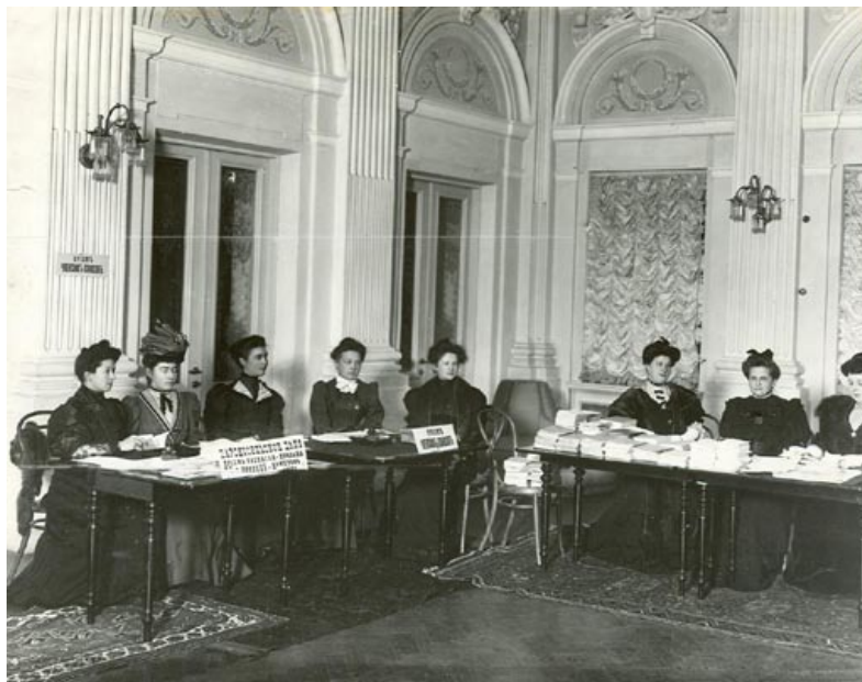
Часть регистрационного отдела по выборам во Вторую Государственную Думу Российской империи

Социалистический проект являлся более развернутым и относился к работающим женщинам – тем, кого социалисты призывали присоединиться к мужчинам (братьям по классовой принадлежности) в борьбе за свержение существующего строя, и касался всех сторон их жизни. Соответственно, рассматривая работающих женщин, а именно, работниц и крестьянок, как свою опору, социалистические партии обещали им освобождение от «двойного рабства». «Партия социалистов-революционеров» и «Российская социал-демократическая партия» включили в свои программы требования всеобщего, без различия пола, избирательного права; всеобщего обязательного обучения; охраны труда, защиты материнства и детства [16–17]. С РСДРП была тесно связана деятельность «Всеобщего еврейского рабочего союза в Польше, Литве и России (БУНДа). На VII конференции партии в 1907 году отмечалось, что ее программой является программа РСДРП [18, с. 317, 332, 778]. БУНДом были даже предприняты некоторые шаги для организации представительства партии на 1-м Всероссийском женском съезде (1908). В резолюцию X Всероссийской конференции БУНДа (апрель 1917) был включен отдельный (XVI) раздел «О женском равноправии»: