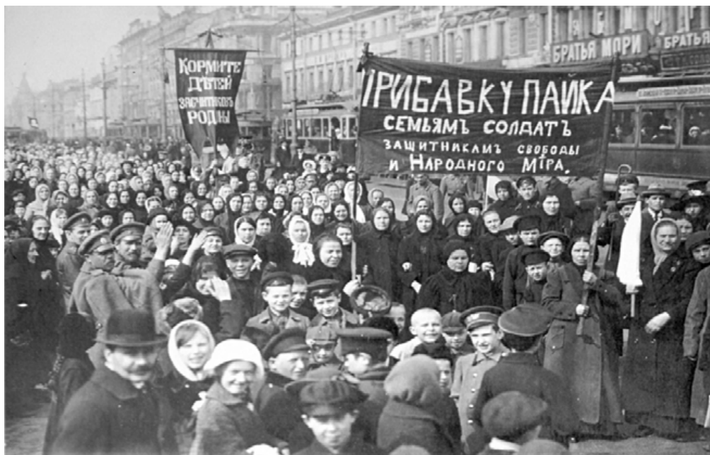
Демонстрация женщин в Петрограде. 23 февраля 1917 года

Февральская революция, начавшаяся с женских демонстраций, сняла программные и тактические различия и разногласия между общероссийскими либеральными партиями. На базе партии кадетов начался процесс консолидации всех либеральных сил. Прекратили свою деятельность монархические партии. Не смогли найти себя в новых условиях октябристы. К концу лета 1917 года в состав центральных комитетов всех ведущих