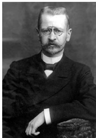
Лев Иосифович Петражицкий, депутат Первой Государственной Думы от Санкт-Петербурга

Партийная позиция по вопросу женского политического равноправия была сформулирована в ходе полемики в либеральной прессе и дискуссии, состоявшейся на 2-м съезде кадетов (январь 1906 года), на котором в повестку по требованию делегатов включили вопрос «о допущении женщин к выборам». Против избирательных прав высказались видные кадеты – П.Б. Струве, отстаивавший неактуальность «в настоящий момент» этого вопроса, поскольку он может отпугнуть от партии многих членов [8, с. 135], и И.В. Гессен, предложивший не тратить время впустую. Их поддерживал П.Н. Милюков. С одной стороны, он считал, что русские крестьянки не подготовлены к политической жизни. С другой – женское избирательное право, по его мнению, уронит партию в глазах многих, оттолкнет от нее [8, с. 156].