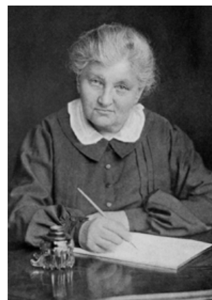
Екатерина Константиновна Брешко-Брешковская