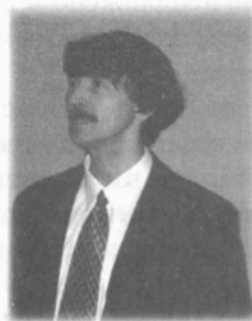
Ю. В. Маслов