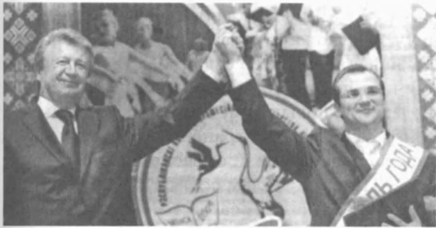
Чествование победителя конкурса «Учитель года Республики Беларусь – 2009»

катеорию, 10 – первую. Все финалисты отмечены грамотами отделов образования, Почётными грамотами облисполкомов и районных исполнительных комитетов.