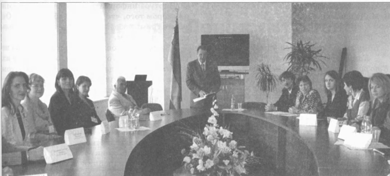
Круглый стол «Секреты успешного педагога»