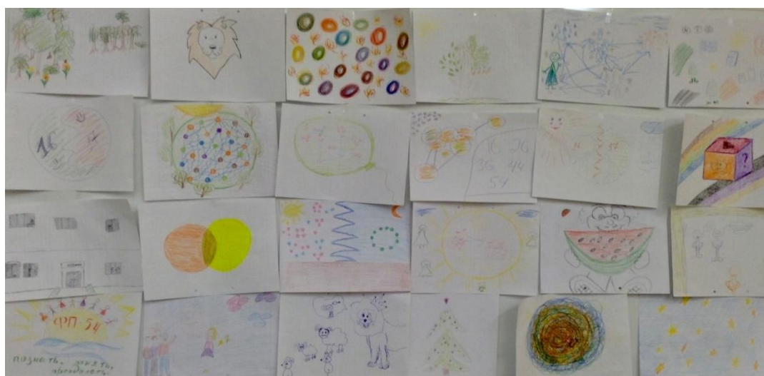
Рис. 2. Образ группы студентов дневной формы получения образования