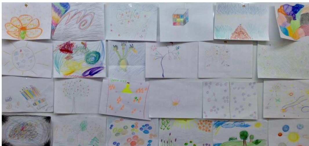
Рис. 1. Образ группы студентов заочной формы получения образования

В результате появлялся самостоятельный арт-объект (рис. 1, 2), с которым была продолжена совместная работа ведущего и группы. Ограничения по времени отсутствуют. Важно получить как можно больше высказываний с целью создания объективной картины образа группы.