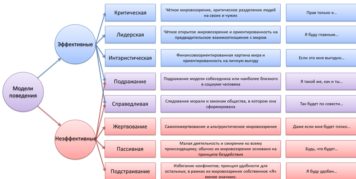
Рисунок 2. – Модели поведения

На основе трудов К. Г. Юнга в современной науке выделяют Неэффективную и Эффективную модели поведения [12], что является недостаточным для применения в литературной сфере. Поэтому мы обратились за консультацией по интересующим нас вопросам к врачу психоневрологу Голубко Елене Валерьевне [6]. Проанализировав результаты консультации, нами была составлена расширенная классификация моделей поведения, включающая 8 категорий: критическая, лидерская, интэристическая, подражание, справедливая, жертвование, пассивная, подстраивание (рисунок 2).