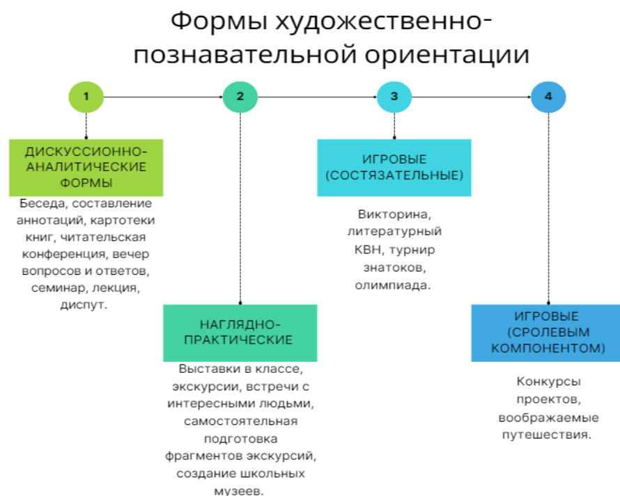
Рисунок 1. – Формы художественно-познавательной ориентации

внеклассных мероприятий [5, с. 257]. Однако, такое многообразие может показаться сложной для начинающего учителя. Но в то же время может помочь более опытному педагогу с выбором наиболее эффективных форм проведения внеклассных мероприятий (рисунки 1 и 2).