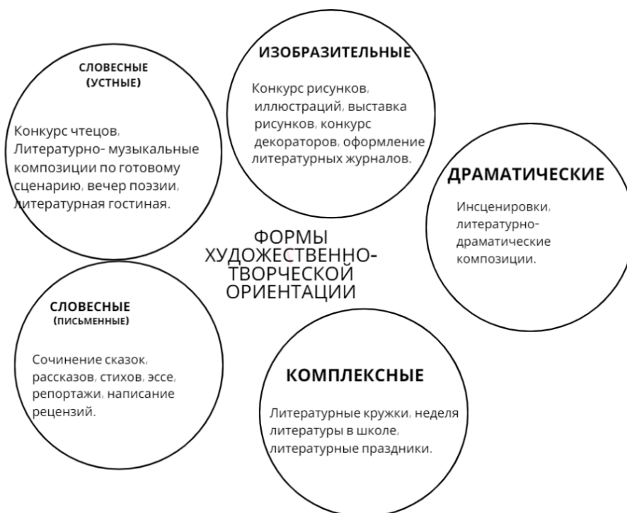
Рисунок 2. – Формы художественно-творческой ориентации