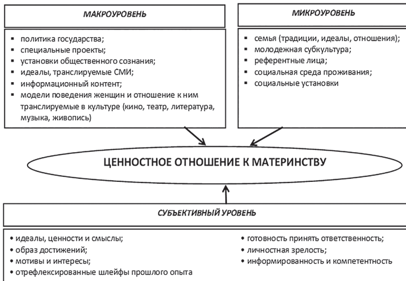
Рисунок 2. – Теоретическая модель формирования ценностного отношения к материнству у учащейся молодежи