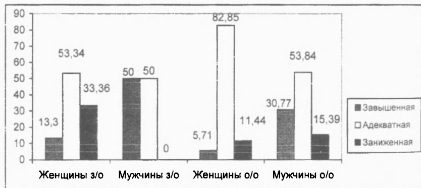
Рис. 2. Показатели самоуважения студентов по шкале Розенберга

Необходимо также отметить, что у студентов стационарной формы обучения почти не наблюдается заниженных самооценок, чего нельзя сказать о студентах заочной формы обучения.