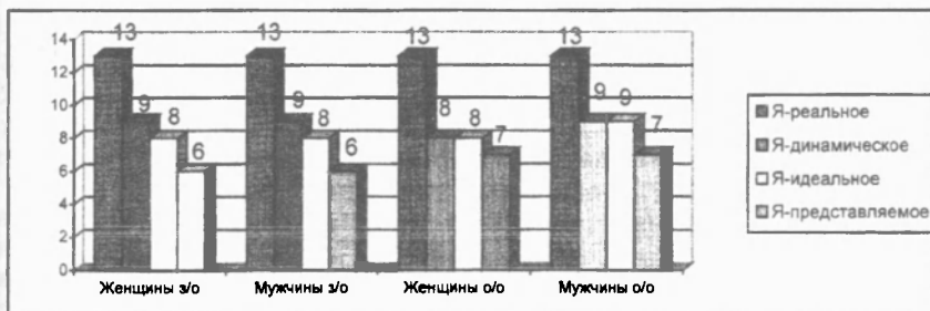
Рис. 3. Структура Я-концепции

Данные, полученные в результате исследования по методике «Самосознание личности» позволили оценить структуру «Я-концепции» респондентов по выборке студентов стационарного и заочного отделения. Показатели средних значений распределились следующим образом (рис. 3)