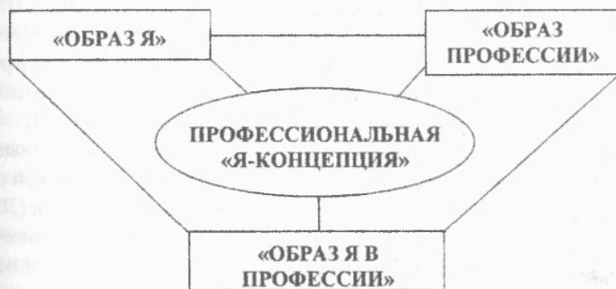
Рис. 2. Структура профессиональной «Я-концепции»

«образ Я в профессии» – осознание себя в профессии, готовность осуществить данный выбор и предпринять усилия к его реализации. Графически это выглядит следующим образом (рис. 2):