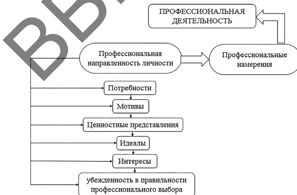
Рисунок 1 – Модель структуры профессиональной направленности личности в юношеском возрасте

«Метасистема может быть функционально представлена в содержании самой системы и может быть репрезентирована в ней в своих существенных чертах и составлять очень специфическую часть самой этой системы». Мы согласны с теорией А. В. Карпова, и считаем, что ПНЛ старшеклассников становится системой со «встроенным» метасистемным уровнем, в которой «профессиональная деятельность», по отношению к ПНЛ является «внешнеположенной» [1, с. 10–11]. Модель структуры ПНЛ в юношеском возрасте представлена на рисунке 1.