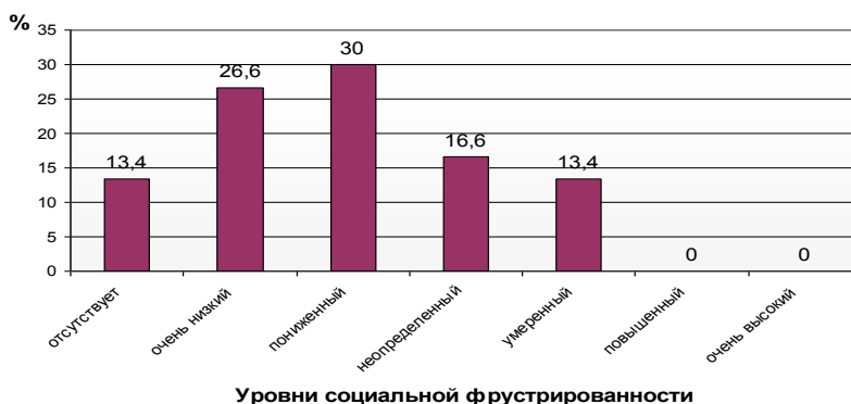
Рисунок 1 – Распределение социальных родителей по уровням выраженности индекса социальной фрустрированности

не менее полученные данные позволяют заключить, что в целом социальные родители удовлетворены своими социальными достижениями в основных сферах жизнедеятельности, а имеющийся у них дисбаланс должен способствовать их личностному и профессиональному росту.