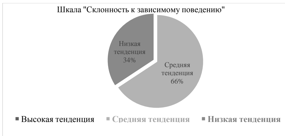
Рис. 1 – Результаты исследования студентов 1-го и 2-го курсов по методике СОП

На втором этапе нами была проанализирована распространённость нехимических зависимостей среди студентов и их окружения. Студенты отметили, с какими зависимостями они сталкивались напрямую (имели опыт зависимости), либо наблюдали их как сторонние лица у своих близких. Также было выявлено, что студенты Института психологии БГПУ в два раза чаще встречались с зависимостями у других, чем отмечали аддикции у себя (376 случаев против 186). Наиболее чаще встречающейся химической зависимостью стало курение (83 случая), нехимической - зависимость от мобильного телефона (43 случая). Наименее распространённой среди студентов стала религиозная аддикция (2 случая), а среди их окружения – зависимость от физических упражнений (17 случаев). В общем подсчёте наименее встречающимся стал гэмблинг (26 случаев) (Рис. 2).