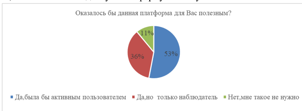
Рисунок 4 – предпочтение Интернет-ресурса

В заключение опроса был задан вопрос для выявления необходимости создания специальной платформы для абитуриентов: «Если бы была создана онлайн-платформа, на которой будет добавляться вся необходимая информация по интересующему Вас направлению, оказалось бы это для Вас полезным? На платформе будет возможность создавать тематические обсуждения, делиться собственными постами, получать информацию от уже поступивших студентов, делиться опытом и т.д.». Результаты стали следующими: Для 53% опрошенных данная платформа стала бы полезной и они ее активно использовали, для 36% платформа является интересной и они обратят на нее свое внимание, но активно использовать на сегодняшний день не собираются, и всего 11% опрошенных уверены, что использовать данную платформу не станут.