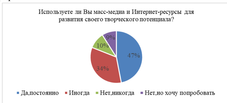
Рисунок 2 – использование Интернет-ресурсов

Большинство абитуриентов используют масс-медиа и интернет-ресурсы для развития своего потенциала с частой периодичностью. Большинство опрошенных (47%) используют их на постоянной основе, что говорит о востребованности интернет-ресурсов и дает понять о необходимости развития масс-медиа в дальнейшем. Из наиболее часто используемых учащиеся выделили: игры и приложения, видео-уроки, курсы и тематические форумы, также некоторые отметили марафоны.