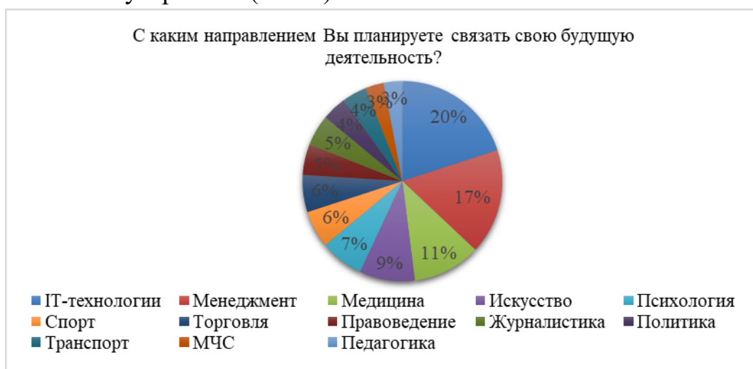
Рисунок 1 – Планирование будущего

(17%), медицина (11%), искусство (9%) и психология (7%), другие направления оказались менее популярными. (Рис. 1)