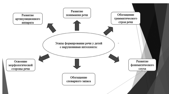
Рисунок 3 – Этапы формирования речи у неговорящих детей с нарушениями интеллекта

Этапы формирования речи у неговорящих детей с нарушениями интеллектуального развития представлены на рисунке 3.