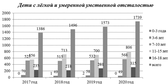
Рисунок – Динамика выявления детей с нарушением интеллекта

Динамика выявления детей с нарушением интеллекта представлена на рисунке 1.