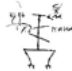
Рысунк 5 – Выява галгофскага крыжа на хорах

Выява Галгофскага крыжа, якая змяшчае толькі частку кананічнага тэксту, знаходзіцца на ўсходняй сцяне хору, злева ад уваходу ў келлю прападобнай Еўфрасінні. «Ножкі» ўвагнутага ўнутр падножжа стаіць на п-падобных «падстаўках». Вертыкальную перакладзіну пакрывае наверх, а гарызантальных перакладзін дзве – верхняя прама (нарисавана не ідэальна прама) і ніжняя косая. Надпісы змяшчаюцца нетыпова. Так, скарачаныя словы «Цар Славы» змешчаны па абодва бакі крыжа, а вось манаграма імя Хрыста, скарачаная да трох літар І ХЪ і слова «Ніка», знаходзяцца па розныя бакі ад крыжа (рысунк 5).