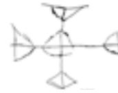
Рысунак 8 – Крыж-крслет на паўночнай сцяне алтара

Шосты від крыжоў сустракаецца даволі рэдка – крыж-крслет. Гэта выява чатырохканцовага раўнабокага крыжа, канцы якога заканчваюцца патаўшчэннямі ў выглядзе трохвугольнікаў. Такі крыж знойдзены на паўночнай сцяне алтара (рысунак 8). Да таго ж срэдахрэсце злучана лініямі на манер ромба. Падобны крыж, але без срэдахрэсця ёсць на паўднёва-заходняй грані паўднёва-ўсходняга слупа. Падобная выява крыжа змешчана ў наўгародскай Сафіі [4, с. 222]. Крыж, канцы якога перасякаюцца перпендыкулярнымі рысачкамі, знаходзіцца ў аркасолі.