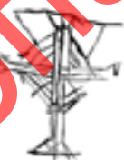
Рысунак 7 – Крыж на паўднёвай сцяне ахвярніка

Пяты від – крыж, упрыгожаны пасярэдзіне. Такі крыж чатырохканцовы, вертыкальная перакладзіна якога большая за гарызантальную. Звычайна гэтыя крыжы прапрапанаваны падвоенай лініяй, пасярэдзіне якой праходзіць яшчэ адна. Сярэдзіна крыжа ўпрыгожана дыяганальнымі лініямі, якія праведзены ад адной да другой перакладзіны (рысунак 7). Магчыма, гэтыя выявы крыжоў звязаны з крыжамі-цельнікамі. Выявы такіх крыжоў сустракаюцца на паўднёвай сцяне ахвярніка (увогуле іх пяць).