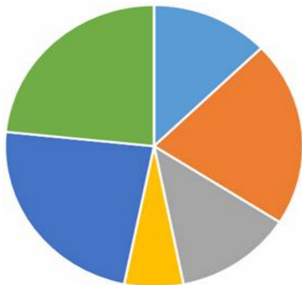
Рисунок 1. – Виды буллинга у подростков

■ проведение бесед с психологом ■ все остальное ■ проведение тренингов ■ набор молодых и опытных учителей ■ мероприятия по сплочению коллектива ■ расширение штаба психологов