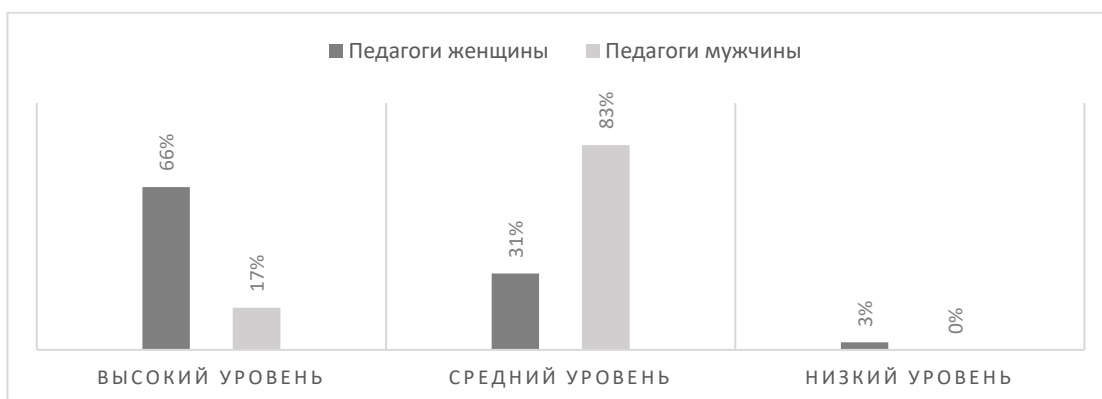
Рисунок 1. Сравнительный анализ уровней общей коммуникативной толерантности среди педагогов мужчин и педагогов женщин

Согласно U-критерия Манна-Уитни ( U_{Эмп} = 190 при p \leq 0,01 ) выявлены статистически значимые различия в уровне общей коммуникативной толерантности среди педагогов