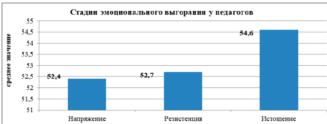
Рисунок 2. Результаты диагностики фаз эмоционального выгорания у педагогов по методике В.В. Бойко.

Результаты исследования фаз эмоционального выгорания у педагогов представлены на рисунке 2 и свидетельствуют о том, что все три фазы эмоционального выгорания у педагогов находятся в стадии формирования.