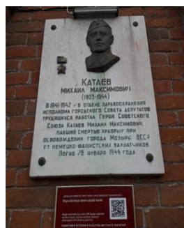
Рис.3. Мемориальная доска М. Катаеву [8]

26 января 1944 г. фашистское сопротивление было сломлено советскими солдатами. Красноармейцы ворвались в город Мозырь Гомельской области. На улицах города начались кровавые бои. Вскоре немецкие войска начали отступать. Неожиданно советские солдаты увидели немецкие танки на одной из улиц города. Цель противника была вырваться из города, чтобы затем обрушить огонь по солдатам. Время на размышление не было. Роль командования взял на себя М.М. Катаев. Он дал команду солдатам обходить противника, а сам с гранатами в руках кинулся под подъезжающий танк. Взорвавшийся танк загородил улицу. Контратака врага была подавлена. Ещё несколько танков были подбиты бронебойщиками, остальным пришлось повернуть назад [1, с. 352].