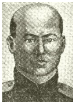
Рис. 7 Искалиев Сундуткали [4]

Искалиев Сундуткали (1924 – 24.6.1944 гг.). Родился в с. Константиновка Чингирлауского района Уральской области, Казахстан. Из крестьянской семьи. По национальности казах. Член ВЛКСМ. На фронте с июля 1942 г. Автоматчик стрелковой роты, рядовой. С. Искалиев отличился при освобождении Быховского района Могилевской области. В ночь на 24.6.1944 г. в бою юго-восточнее д. Лудчицы в числе первых ворвался в траншею противника. В критический момент боя закрыл своим телом амбразуру вражеского