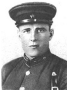
Рис. 6 Озмитель Фёдор Фёдорович [4]

названы улица и школа на родине, улица в с. Рузаевка Кокчетавской области и в Минске. В селе Гавриловка и г. п. Бобр В. М. Чеботареву установлены памятники [1, с. 562].