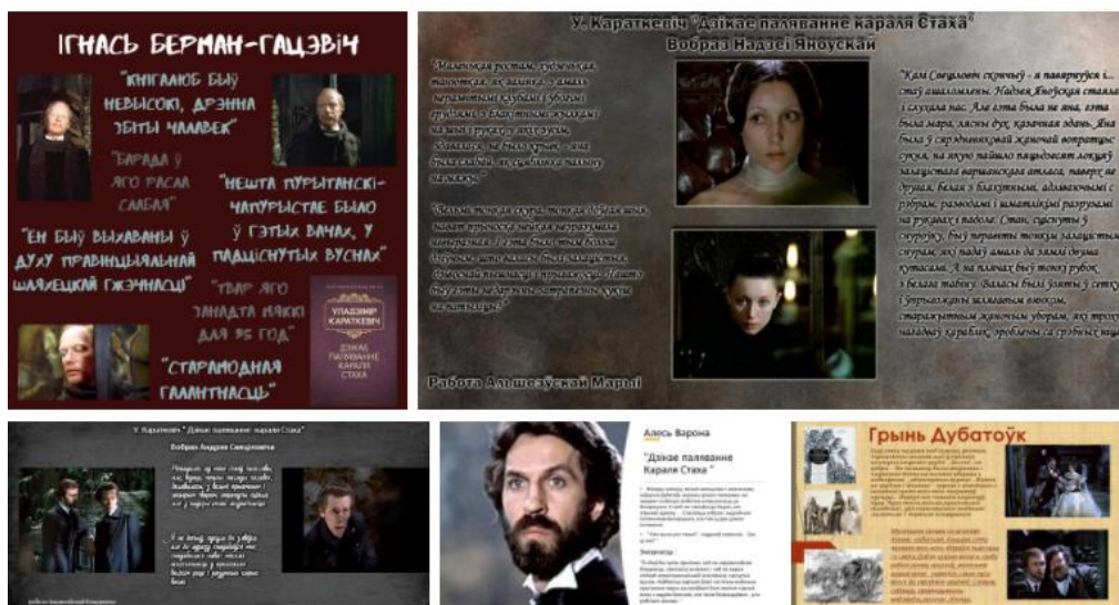
Малюнак 1. Цытатны партрэт кінагероя: фрагмент калектыўнага медыяпраекта вучняў IX класа па аповесці У. Караткевіча «Дзікае паляванне караля Стаха» і мастацкім фільме «Дикая охота короля Стаха» (рэж. Валерый Рубінчык)

Адной з форм інтэрпрэтацый літаратурнага твора з'яўляюцца яго кінаверсіі, скарыстанне фрагментаў якіх метадычна працуе на розных этапах работы з літаратурным творам [9]. Прымяняць кінаверсіі мастацкіх твораў прапануюць і аўтары вучэбных дапаможнікаў новага пакалення [6]. Дадзеная форма работы прадугледжвае падбор цытат для вобраза літаратурнага героя, прапанаванага кінаінтэрпрэтацыяй літаратурнага твора. У працэсе такой работы ажыццяўляецца параўнанне літаратурнага і кінапартрэта героя.