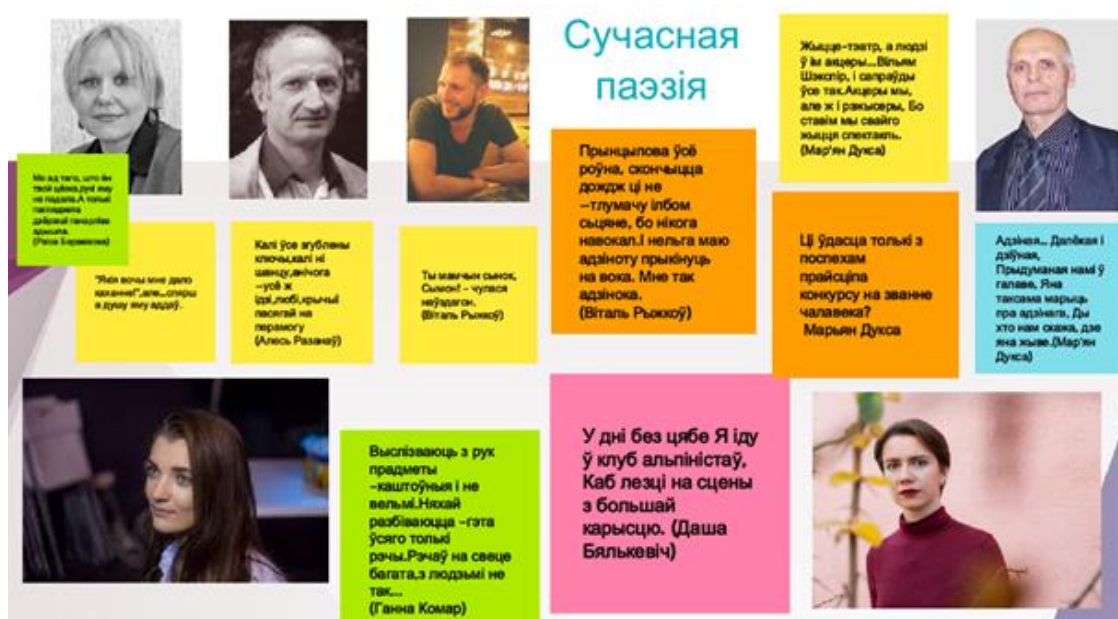
Малюнак 4. Цытатны інтэрактыў па раздзеле «Сучасная беларуская паэзія», сэрвіс Google Jamboard.

Інтэрактыўная онлайн-дошка Google Jamboard дае шырокія магчымасці для групавых форм работы ў фармаце сеткавага ўрока, дазваляе адначасова працаваць у рэжыме рэальнага часу вялікай колькасці ўдзельнікаў.