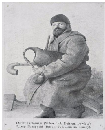
Dudar Bielaruski (Wilen, hnb. Dziesien, pawietu). Дудар Беларускі (Вілен, губ. Дзясен, павету).

На белорусских землях было много различных музыкальных инструментов, которые прочно вошли в традиционную культуру. Например, дуда – европейский народный музыкальный инструмент, являющийся родственником шотландской волынке, был одним из самых распространенных музыкальных инструментов на территории Беларуси. Её история берет своё начало еще в дохристианских, языческих временах. Дуда играла важную роль в жизни белорусов, она использовалась на семейных и календарных праздниках или важных событиях: при рождении человека, а также после смерти на его похоронах играли на дуде. Она, как символ гармонии, успокаивала богов, позволяя человеку спокойно пройти в мир иной. При этом дуда создавалась в начале года, в течение года на ней играли, а в конце года, на колядках, её, если год был хороший, вешали на дуб, а если плохой, то разбивали об него [4]. Так каждый год создавалась новая дуда.