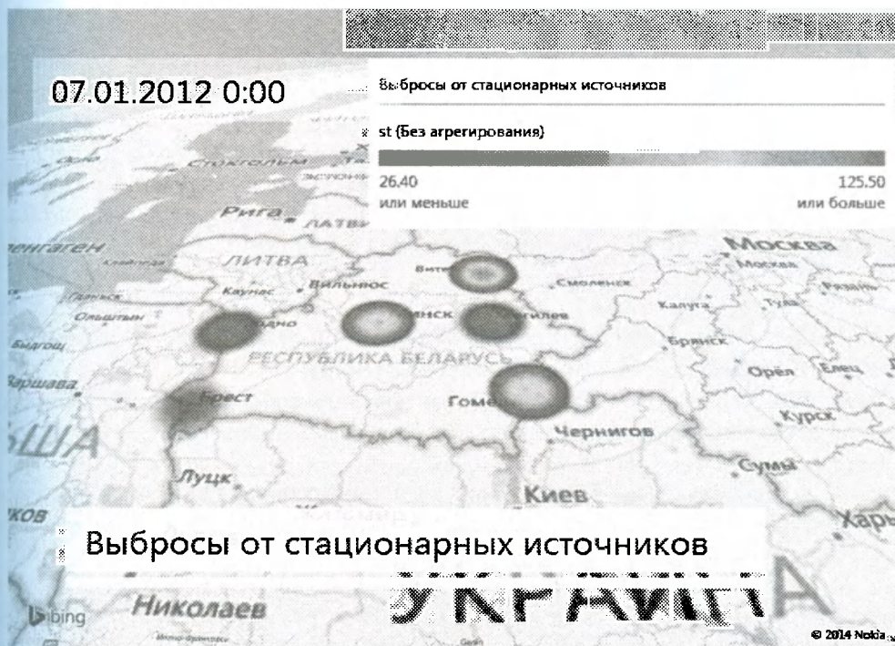
Рис. 2. Пример выполнения задания. Визуализация с географической привязкой

Далее студентам предлагается выполнить следующие задания. На основе приведенных данных из таблиц (данные о выбросах в атмосферу от стационарных и мобильных источников) построить 3-D визуализацию и географическую привязку этих данных с помощью средства Geoflow Power Map в MS Excel 2013. Сделать динамическую демонстрацию изменения значений выбросов вредных веществ по годам в целом, по видам источников загрязнения (стационарным и мобильным), а также сопоставить смертность от заболеваний (новообразований) с количеством выбросов вредных веществ в атмосферу. Пример одного из кадров демонстрации приведен на рис. 2.