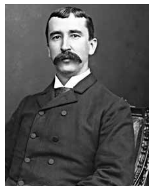
Герберт Б. Адамс