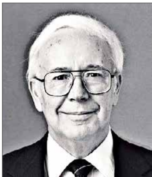
Террелл Х. Белл

вого превосходства в образовании. В своем выступлении на мероприятии министр образования США Террелл Х. Белл (Terrel Howard Bell) среди важнейших задач американского образования определил, что школа должна подготовить учащегося к выполнению требований высокой должности гражданина. Каждый ученик обязан изучить историю человечества во всех ее социальных, политических, управленческих и экономических аспектах [12].