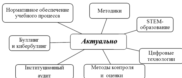
Рисунок 1. – Актуальные темы повышения квалификации педагогических работников

Таким образом, нам удалось построить модель повышения квалификации на 2021 год, который должен стать годом преодоления вызовов, годом стабильности и системности в образовании.