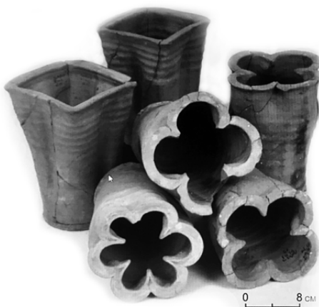
Малюнак 3. – Пячная гаршковая кафля. Кан. XIV – пач. XV ст. Гродна, Стары замак

Кухонны посуд, а менавіта гаршкі, у XIV–XV стст. у вобласці плечука набываюць вострае гатычнае рабро.